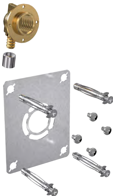
MONOTROU WC, machine à laver et robinets de jardin