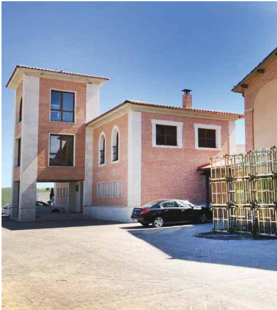
TRUS - Una delle cantine più importanti di Valladolid

A gennaio 2021 è stato scelto il sistema di tubazioni preisolate Microflex per realizzare l'impianto idrico, sanitario e di riscaldamento della nuova sezione della fabbrica di una delle più importanti vinerie di Valladolid. Si tratta di una cantina chiamata TRUS ed è situata in una delle migliori zone ricche di vigneti della Valladolid, dove i vini ottengono il certificato di origine Ribera del Duero.