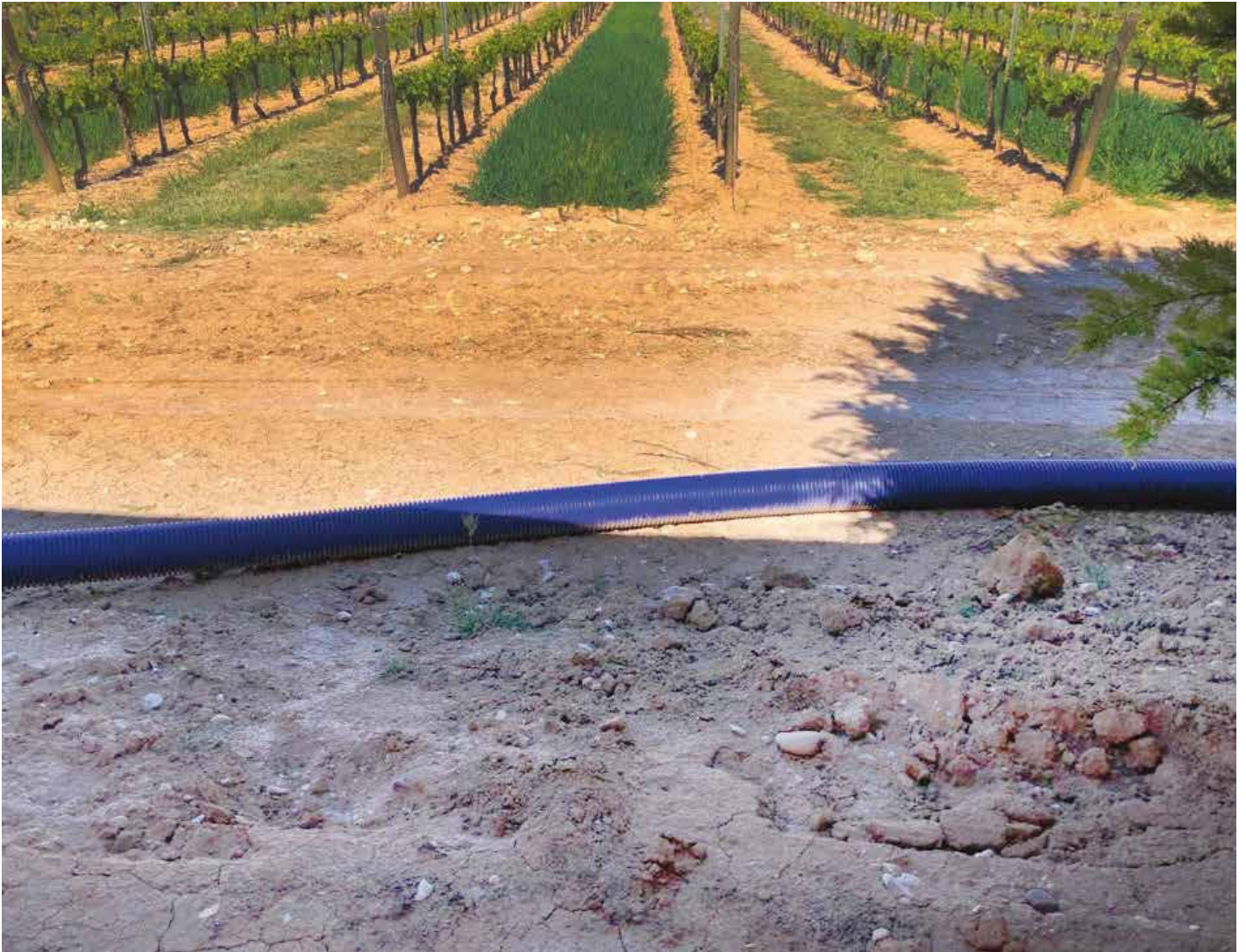
Sistema di tubazioni preisolate Microflex