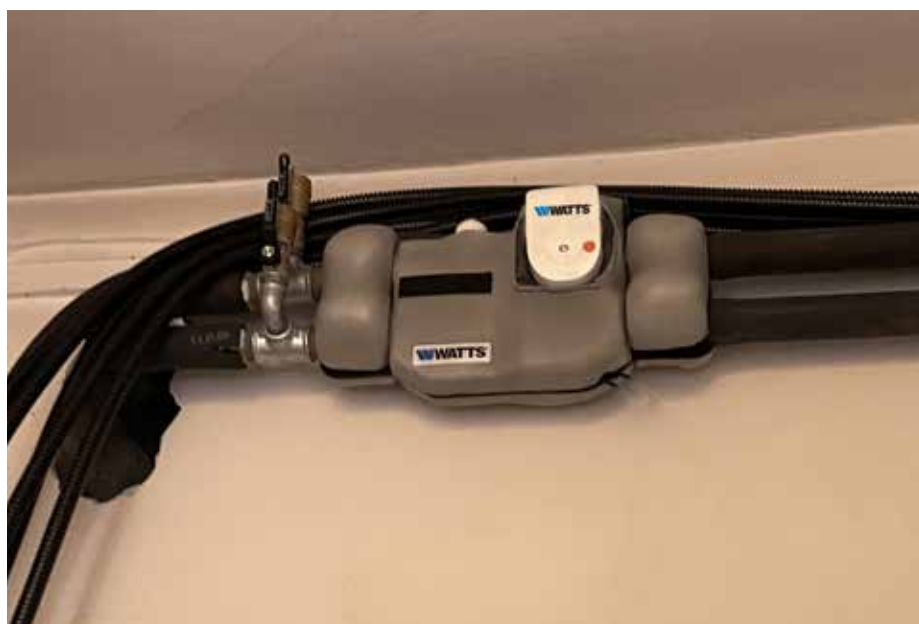
Panorama general de la planta.

Conforme a la Directiva MID 2014/32/UE D.Lgs n 22 2/02/07, el módulo de termostatación y contabilización del calor My Home 2 de la serie Domocompact de Watts, de hecho, se programa en función de las necesidades reales de la instalación sobre la base de las necesidades de caudal (requerido hasta 1500 l/h).